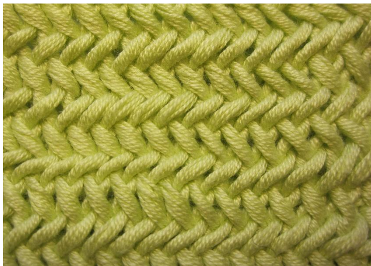
Kalanruotoneulos, oikea puoli