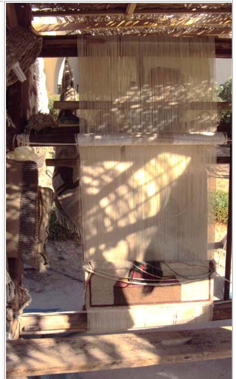
Kuvakudoksia tehdään myös pystykangaspuissa. Oheisen kuvan puissa on meneillään rjiijyn tapaisen kudonnaisen teko.