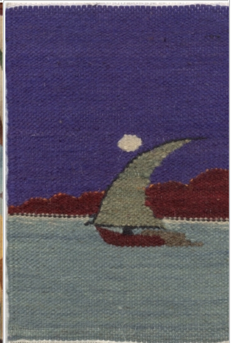
Kuvan pieni kuvakudos on ostettu mattokaupasta Egyptin Luxorissa. Siinä on kuvattu felucca (purjevene) lipumassa pitkin Niiliä. Kuvakudos on kudottu puuvillaloimeen kamelinkarvalangalla.