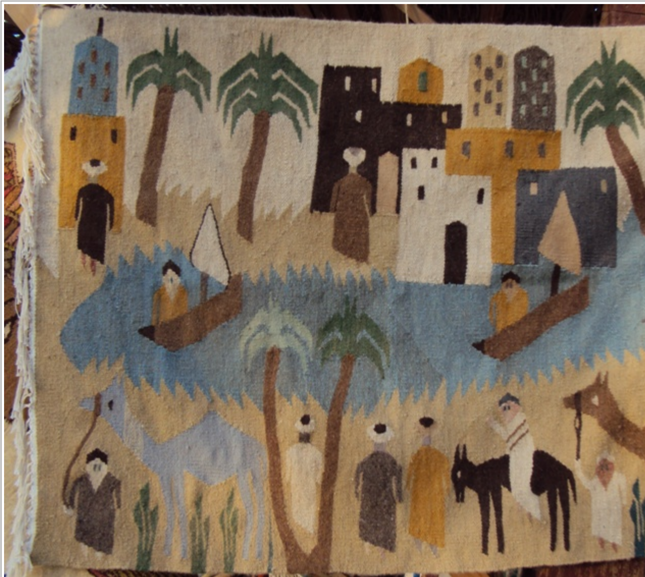
Kuvan kuvakudos on kuvattu El Gounassa, jossa kuvakudoksia myydään lähinnä tureisteille. Egyptiläisissä kuvakudoksissa kuvataan usein Niilin maisemia, luontoa ja kyläelämää.