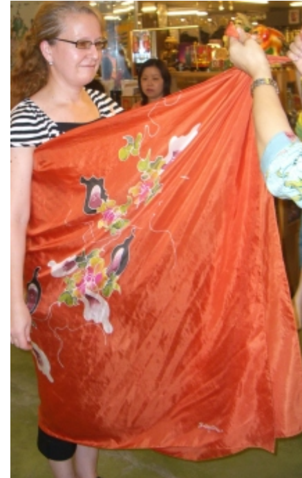
Sarongin sitominen käynnissä