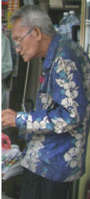
Batiikkipaitainen mies Kuola Lumpurin kadulla