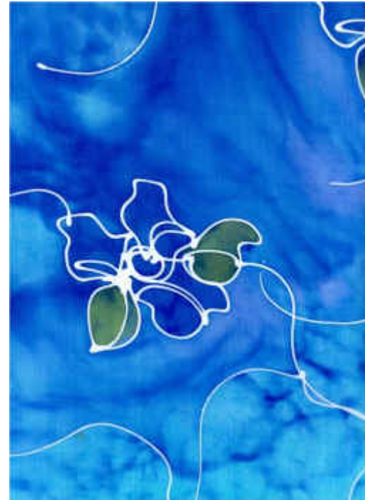
Tjantingilla ja siveltimellä maalattua batiikkia