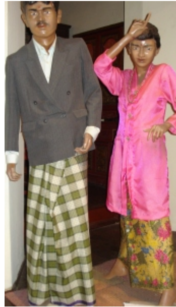
Chitty (intialaisten ja malaijien seka-avioliittojen jälkeläiset)