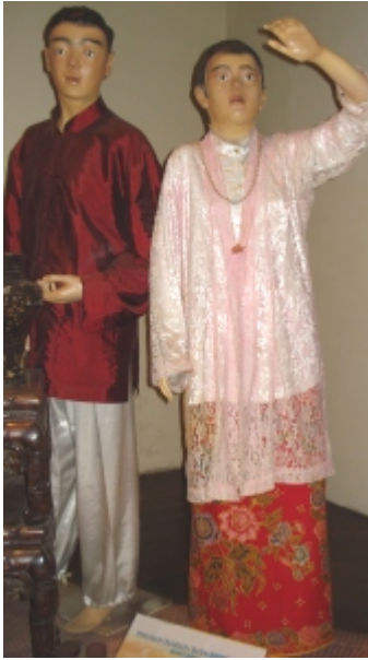
Baba-nyonyat (kiinalaisten ja malaijien seka-avioliittojen jälkeläiset)