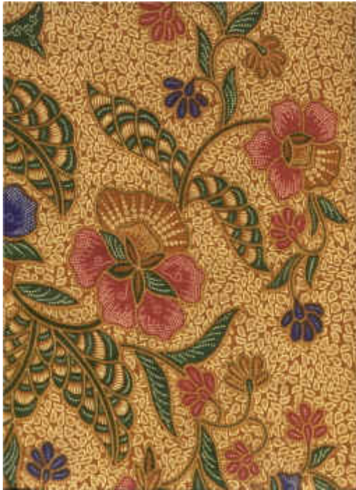
Teollisesti painettua batiikkia