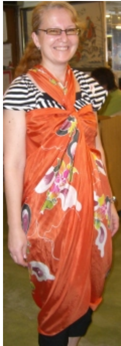
Sarong kaulan ympärille kiedottuna