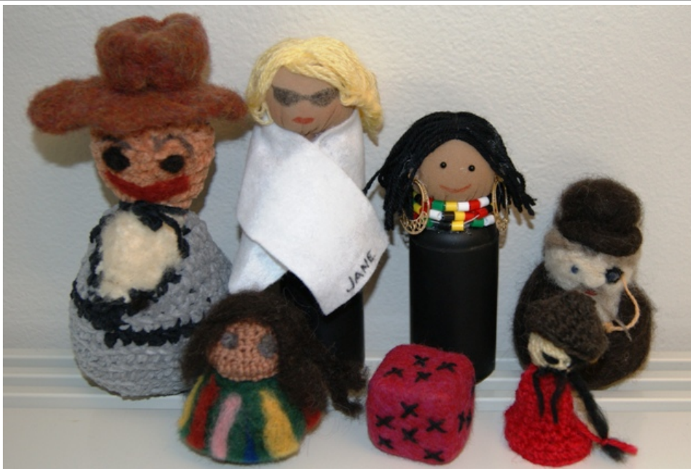
Pelihahmot ja noppa