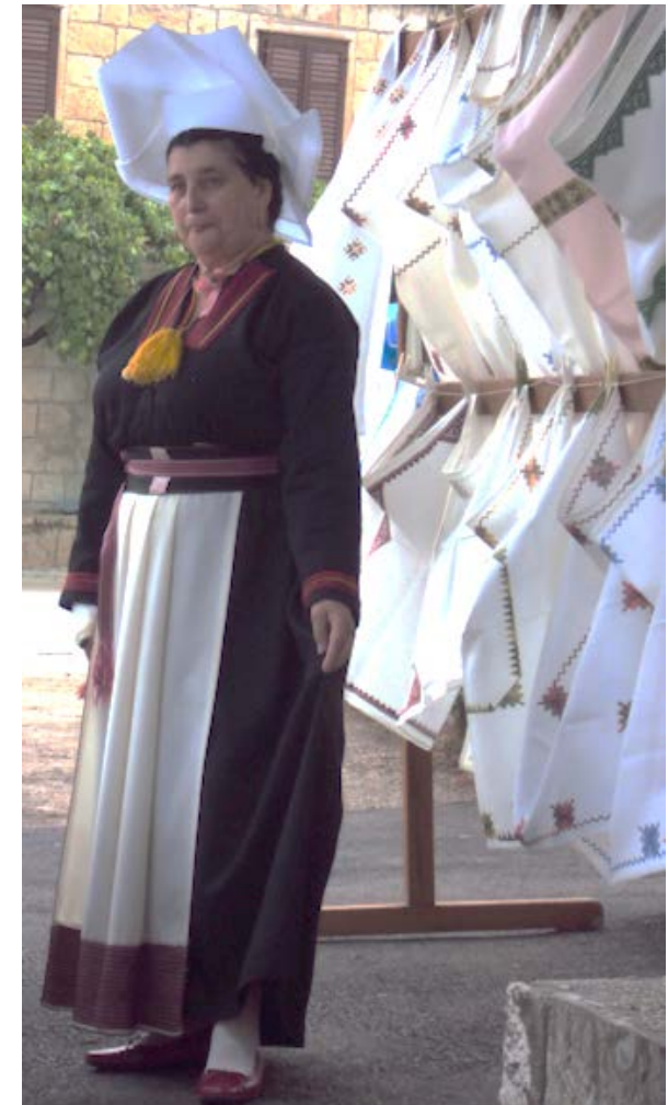
Naimissa oleva nainen on perinteisesti käyttänyt tärkättyä liinaa päähineenä.