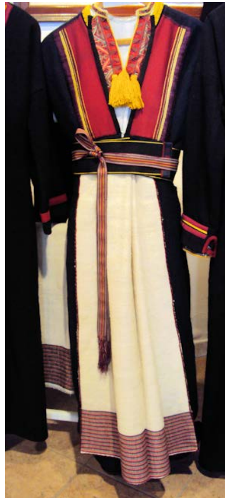
Naisen talviasu Cilipi-kylän etnografisessa museossa.