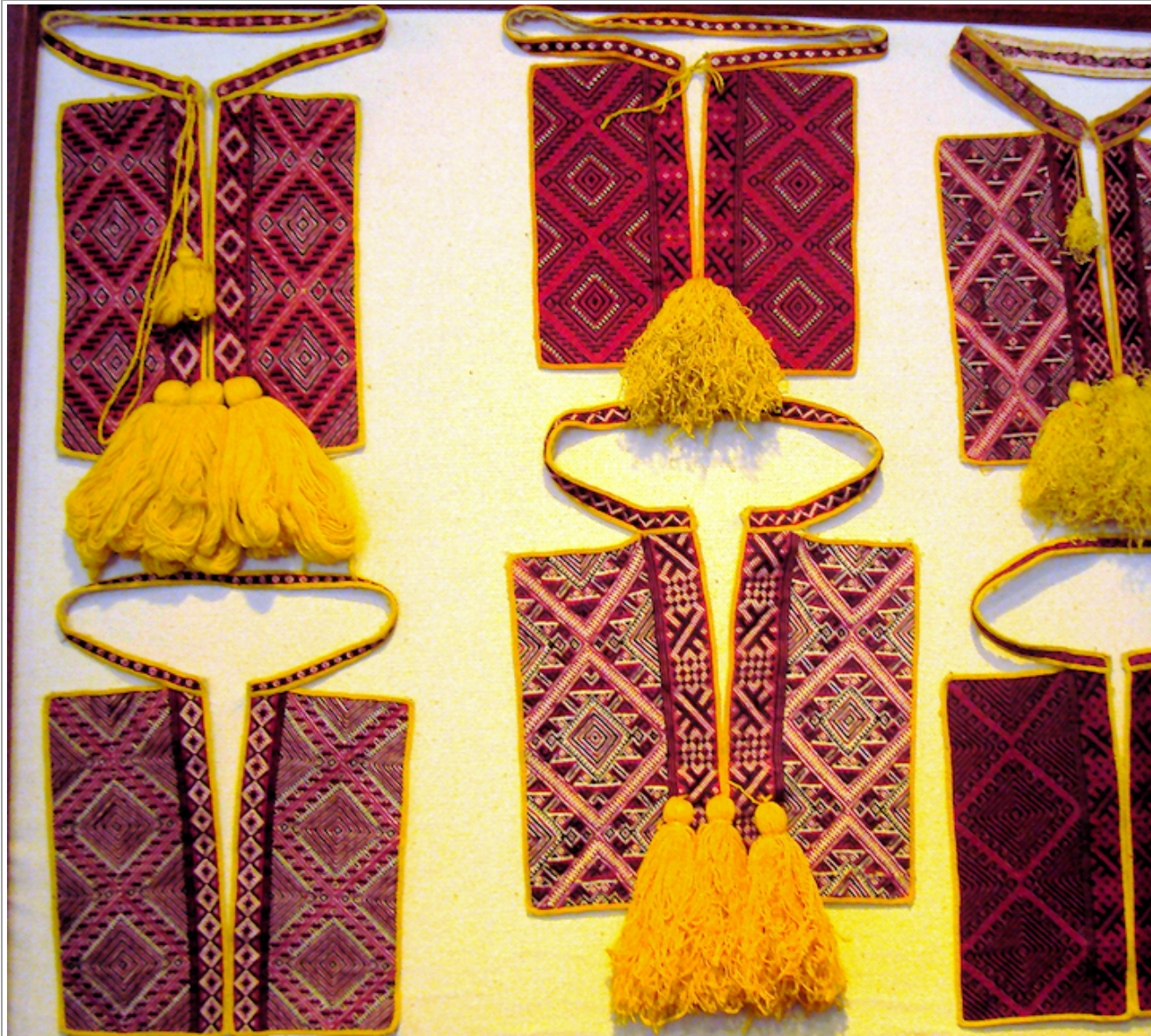
Puseroon kiinnitettäviä kirjottuja kauluksia Cilipi-kylän etnografisessa museossa.