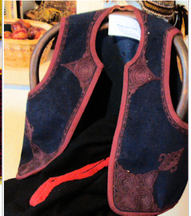
Miesten puvun liivi