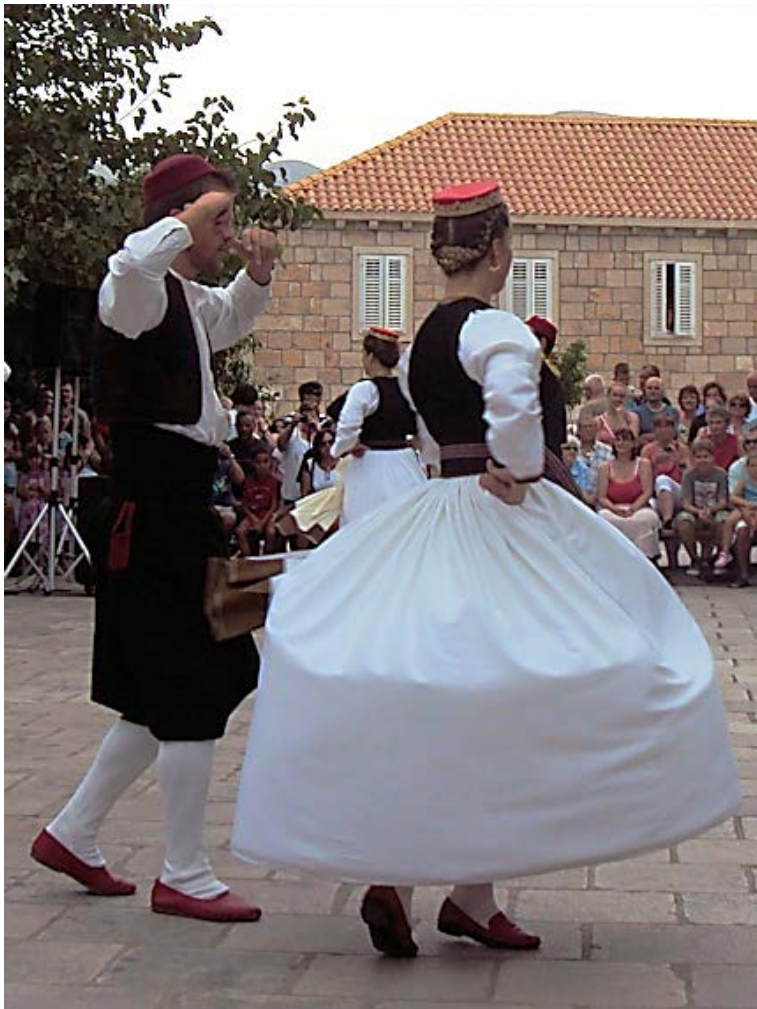
Cilipi-kyläläiset Lindo-tanssin pyörteissä.