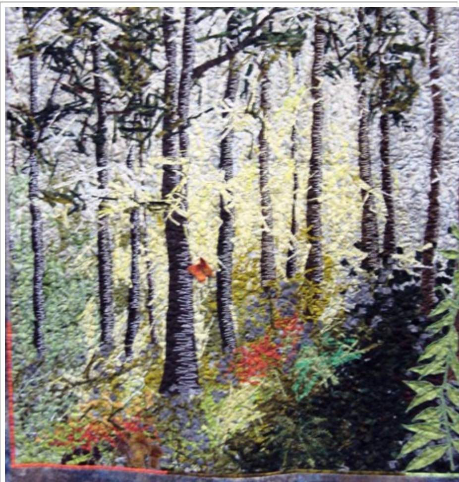
Tämän työn aiheena oli "maailma tarvitsee enemmän puita". Todella taidokasta langoilla maalaamista.