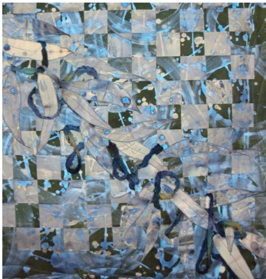
Tässä työssä oli hyödynnetty kivasti kolmiulotteisuutta.