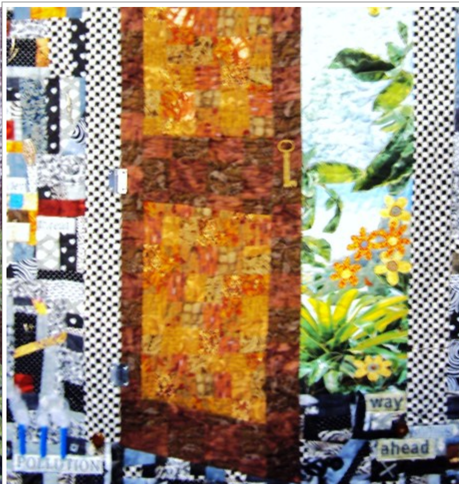
Tämän työn aiheena oli "ovi tulevaisuuteen". Harmaat tilkut kuvaavat maailman kaaosta, punaiset tilkut sotien verta ja oranssit tilkut toivoa paremmasta. Ovi on raollaan parempaan tulevaisuuteen.