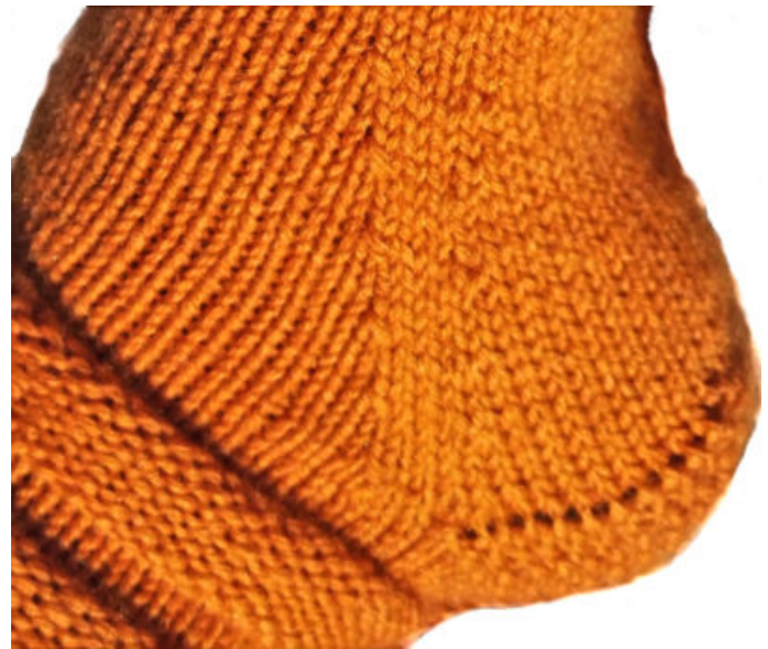
Kantapää ja nauhakavennus lähikuvassa.