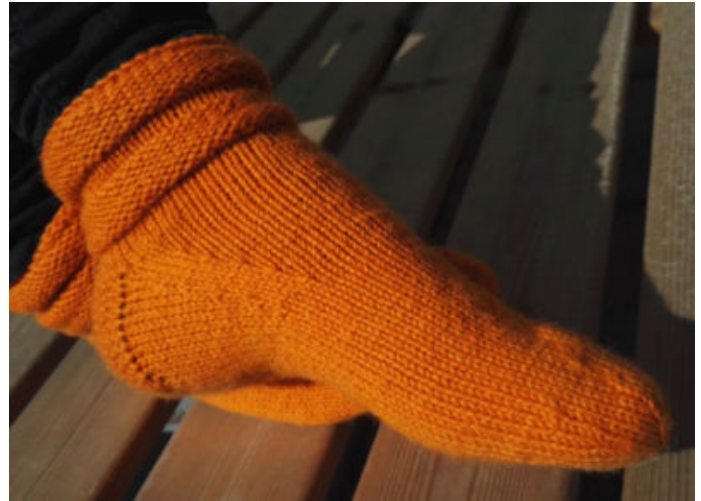
Kuvasta näet kantapään ja terän kavennusosan rakenteen.