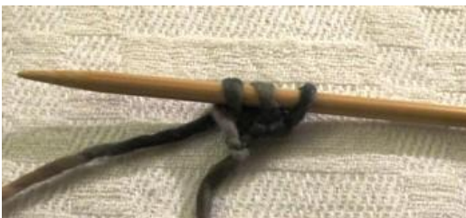
1. KUVA 1.-2. kerros: Luo alkuun 3 silmukkaa ja neulo ne oikein.