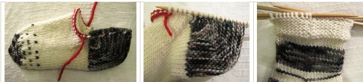
13. KUVA Enää puuttuu sukan varsi...