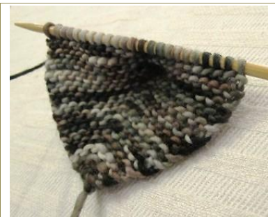
3. KUVA Kantapää ensimmäinen sivu on valmis ja pohjaosa tekeillä. Jatka lisäysten jälkeen pohjaosaa edestakaisin aina oikein. Neulo kerroksia n. 2/3 lisäskerrosten määrästä. Kuvassa näkyy kantapään sisäpuoli.