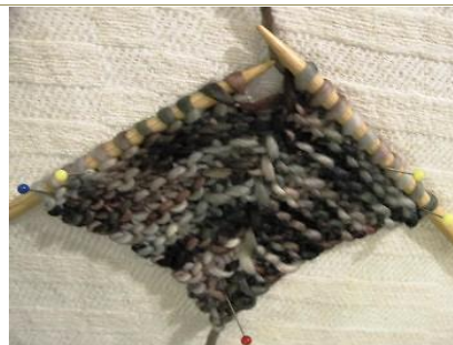
2. KUVA 3. ja kaikki parittomat kerrokset: Neulo oikein. Lisää puikon keskimmäisen silmukan molemmilla puolilla 1 s eli tee langankierto. Lisäskerrosten määrä = yhden puikon silmukkamäärä.