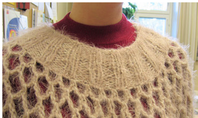
Kuvan päntie neulotaan alhaalta ylöspäin ja kavennetaan vaihtamalla puikkoja pienempiin työn aikana.