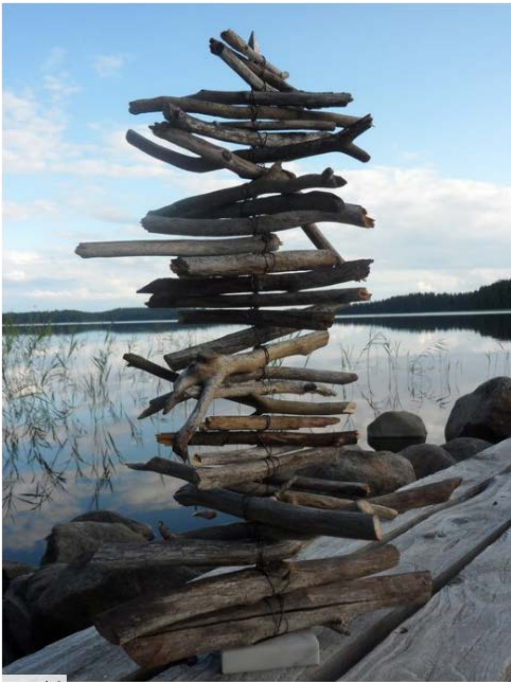
Tikkutaidetta. Saman sorttista olen minäkin harrastanut, kerännyt rannalta meren tuomia ja hiomia puunkappaleita ja sovitellut niistä luomuksia.