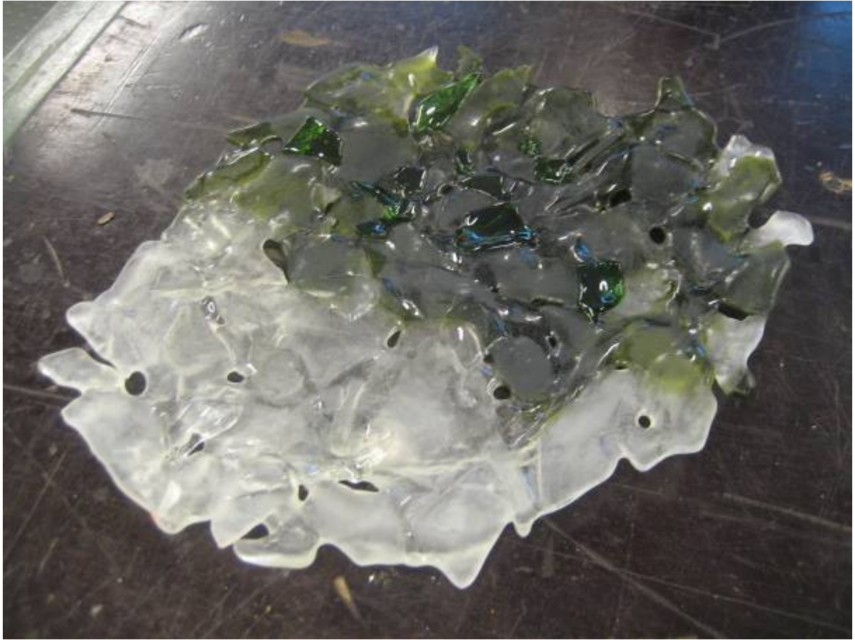
12. Den färdiga produkten!