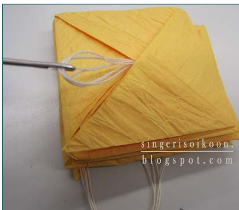
7. Vie lanka neliön keskeltä taitosten läpi työn aloituspuolelle.