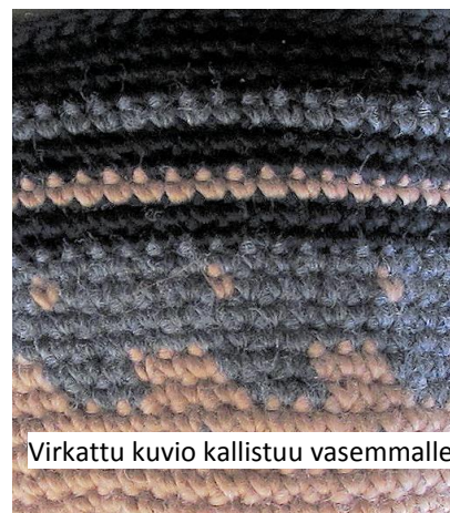
Virkattu kuvio kallistuu vasemmalle.

12. - 15. krs ei lisäyksiä, työssä 6 \times 9 s = 54 s 11. krs 2 ks mallikerran ensimmäiseen silmukkaa, muihin yksi ks 10. krs ei lisäyksiä 9. krs 2 ks mallikerran ensimmäiseen silmukkaa, muihin yksi ks 8. krs ei lisäyksiä 2 - 7. krs 2 ks mallikerran ensimmäiseen silmukkaa, muihin yksi ks 1 krs virkkaa lankalenkkiin 6 kiinteää silmukkaa