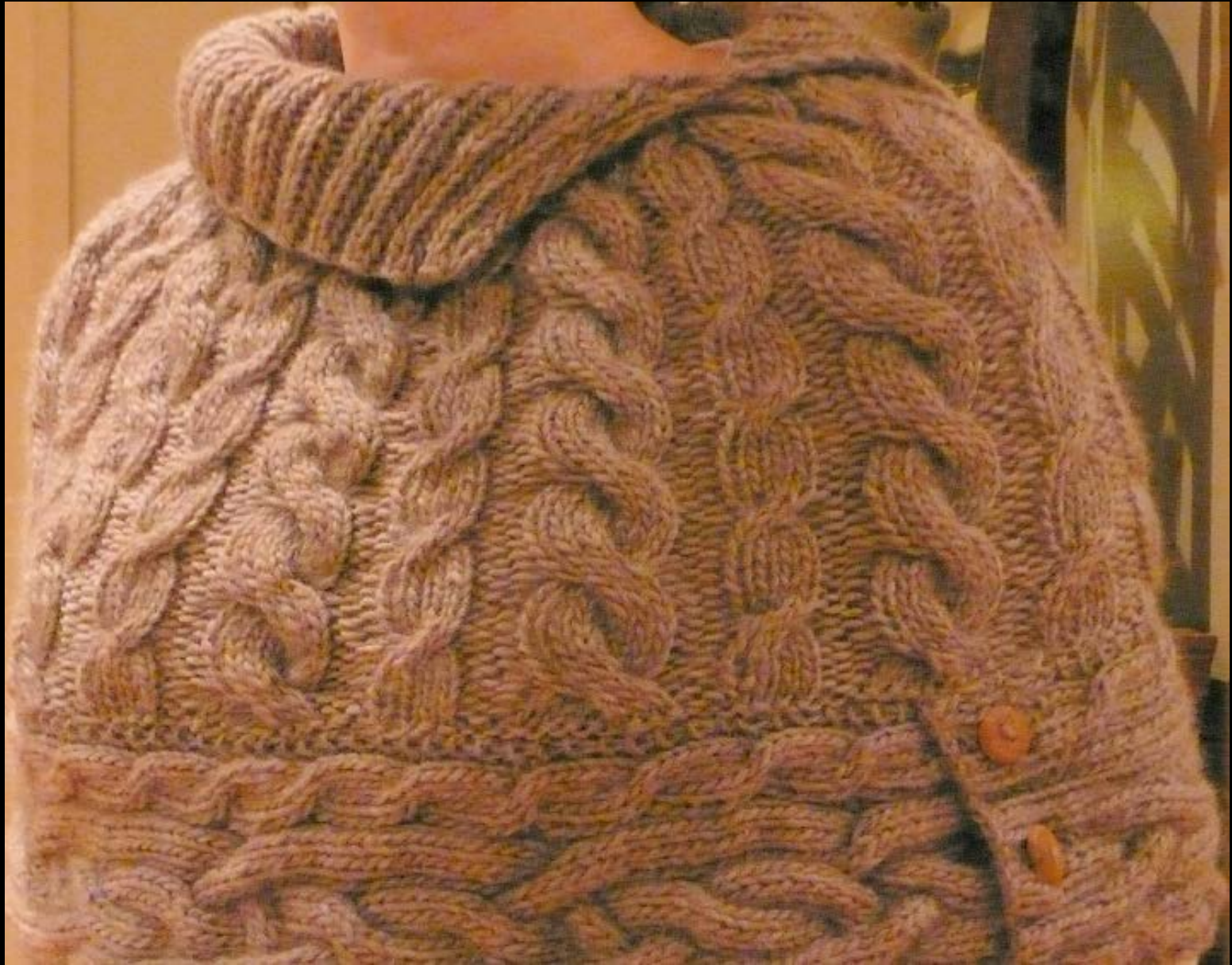
11. Palmikko-poncho. Ihan omaa suunnittelua ja lämmittää jo uuden omistajan harteita. TP