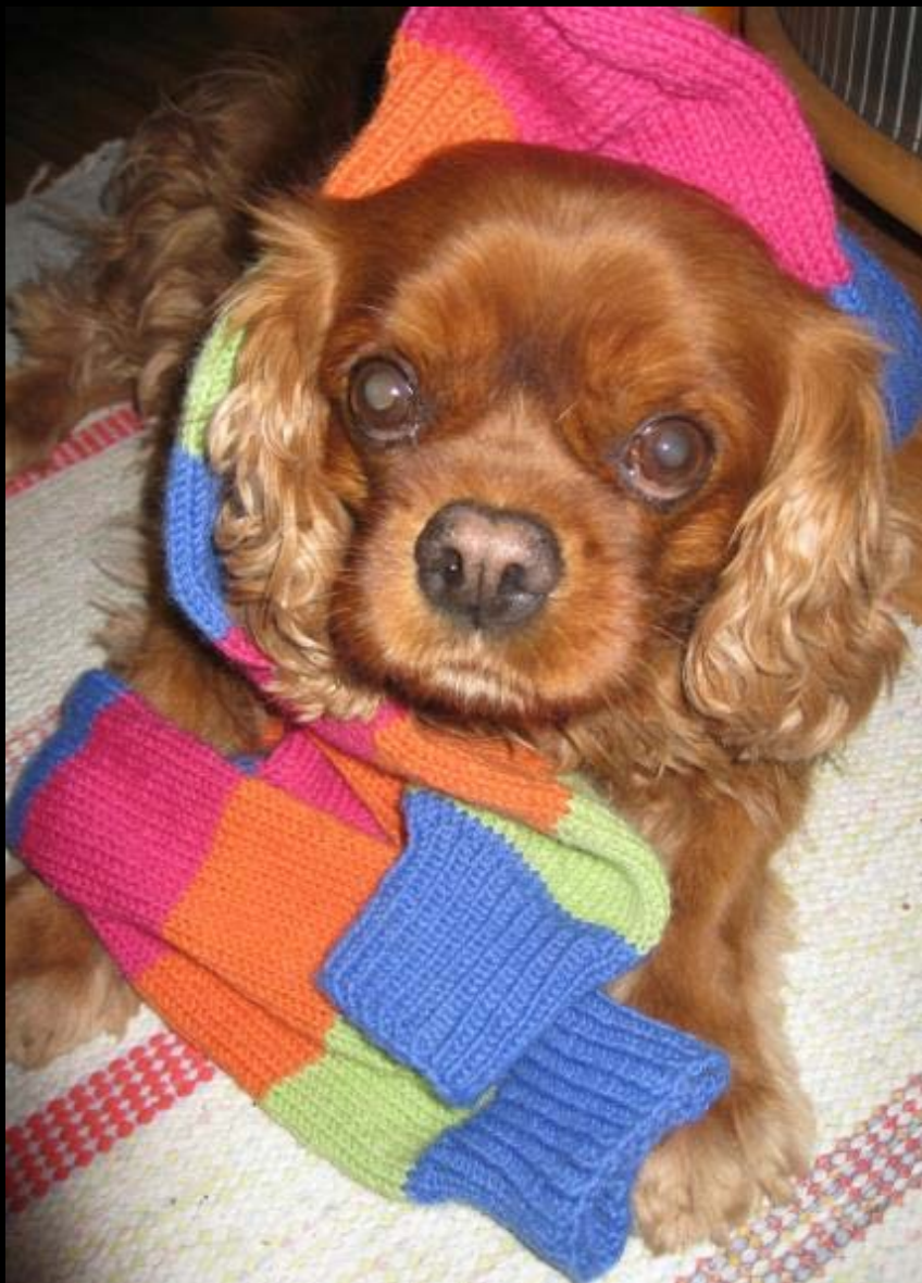
7. Mutrusuu karkotussukat :) RS