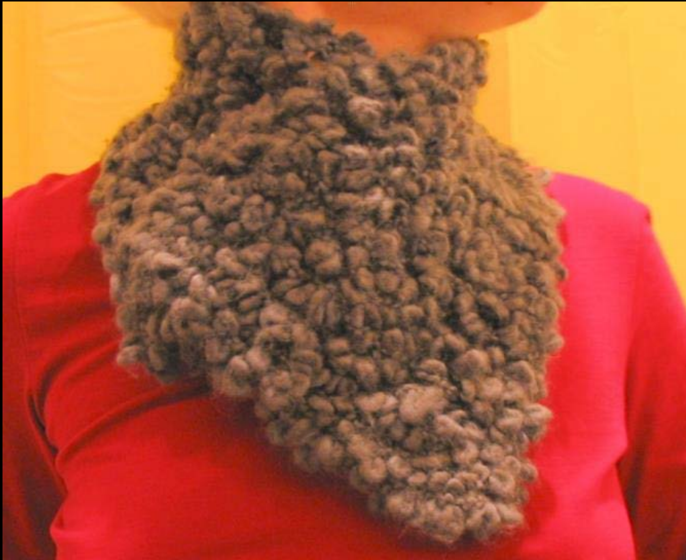
10. Kauluri HH