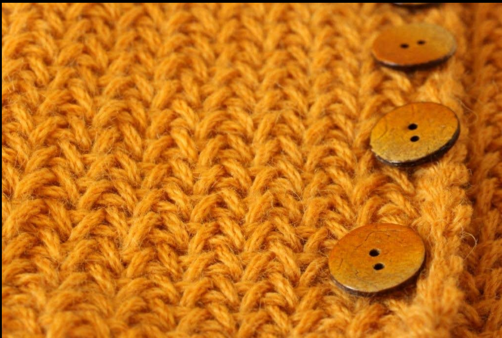
16. Nappeja vaille valmis vol2 AMR