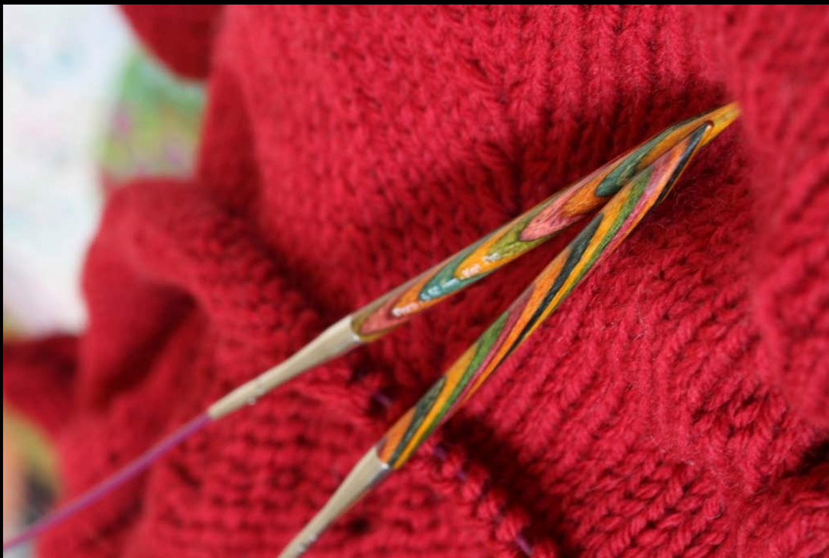
18. Tauon paikka vol2 AMR