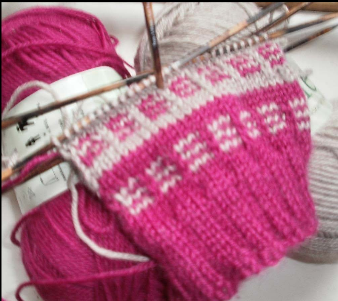
3. Sukanvarsi aluillaan Keski-Pohjanmaan Körtti-raidalla.