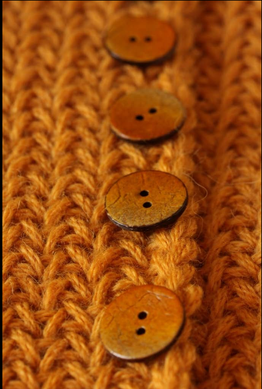
15. Nappeja vaille valmis AMR