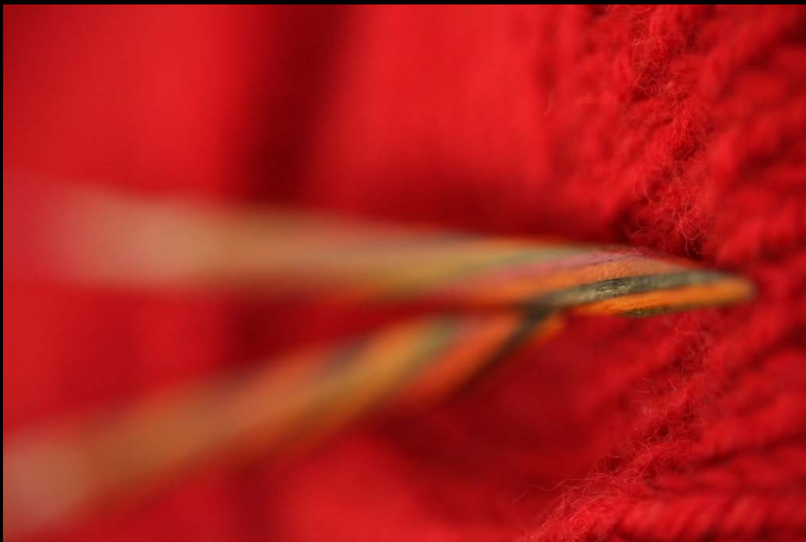
17. Tauon paikka AMR