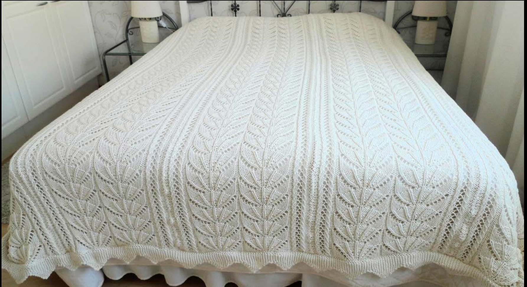
14. Suurikokoisin koskaan neulomani työ. Peitto on oma malli, olen sitä muutellut, neulepuseron kuvioita. Viisi yhteen ommeltua kaitaletta ja kolmella sivulla reunapitsi. AL