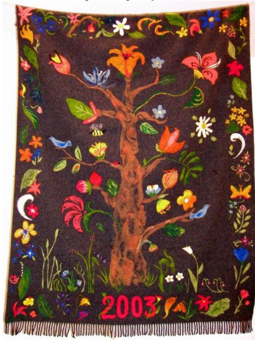
VYK:n opettajien yhteishuovutus keväällä 2003