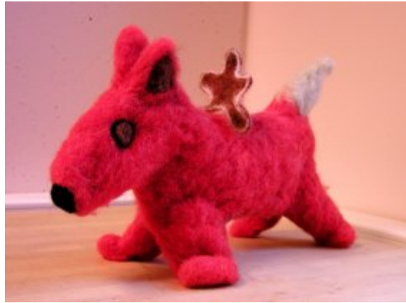
Piparkakkupoika ja kettu