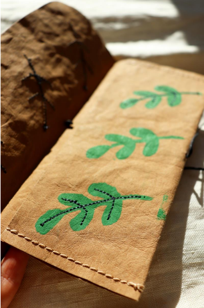
Nahkapaperista tehty pussukka, jossa on sapluunapainannalla tehtyjä kasvikuviota ja konekirjontaa.